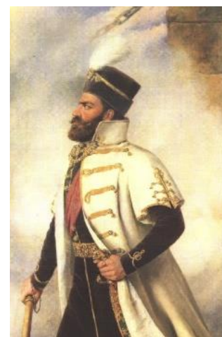
Kép: Zrínyi Miklós, valamint ahogyan ünneplőben kirohan a maradék hős hun harcosokkal