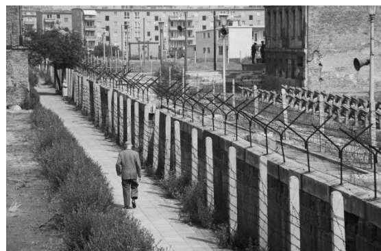
A kész fal a fegyveres őrséggel

Az Európai Parlamenti Közgyűlés válaszára nem kellett sokat várni. 1961 október 10-én és 11-én a Közgyűlés politikai tanácsa Nyugat-Berlinben tartotta ülését. Az ülésen a képviselők az Európai Közöség berlini lakosok iránt érzett szolidaritásukat akarták kifejezni. Hans Furler elnök nyilatkozatában Berlint a szabad Európa jelképének nyilvánította. Az ülésen a további felszólalók egyhangúlag elítélték a keletnémet kormány szabadság ellen intézett támadását.