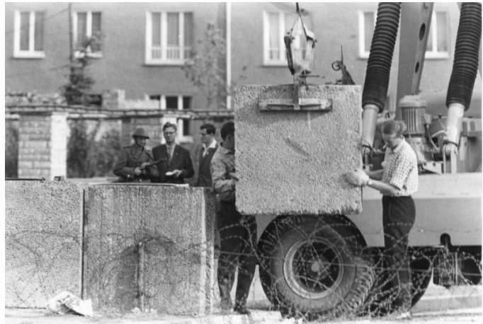
A betonfal építése, előtte a szögesdrót

1961 nyarán az NDK népesség vesztesége 30 000 fő fölé ugrott, így szükségessé vált a határ lezárása, amelyhez a szükséges engedélyt Walter Ulbricht szerezte meg Hruscsov szovjet pártfőtitkártól. Ennek értelmében 1961 augusztus 12-éről 13-ra virradó éjjel a szovjet fegyveresek lezárták a nyugati szektor szovjet szektorral és az NDK területével érintkező határait, úgy, hogy még az NDK területén szögesdrótból kerítést húztak fel, majd tőle 2-3 méterrel árkokat ástak, hogy megakadályozzák a kerítés autóval történő átszakítását. A szovjet szektorban forgalomelterelést alkalmaztak, illetve a kerítés mellé állított őrség aka-