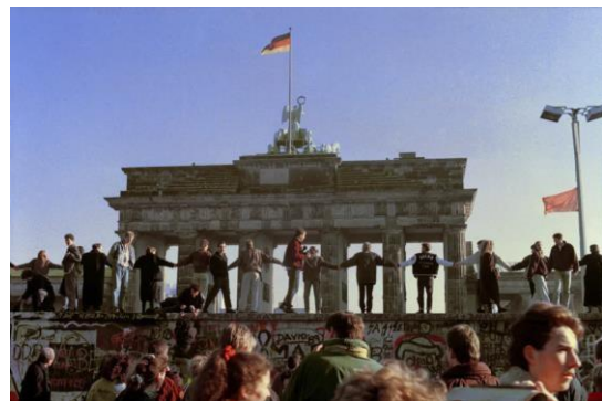
A berlini fal leomlása

A berlini lakosok közel 30 évig túrték a megosztottságot, azonban 1989 november 9-én megtört a jég és az utcára vonuló polgárok a követeléseiket már nem csak szavakban fogalmazták meg, hanem tettekhez is folyamodtak: megkezdték a “szégyenfal” lebontását. Ez a hatalmas jelentőségű tett egy új korszak kezdetét jelentette: megszűnt a megosztottság, az áruhiány és az emberek visszakapták a szabadságjogukat. Ezzel együtt a fal megszűnése jótékony hatást gyakorolt az Európai Közösség intézményeinek működésére is, valamint elősegítette a német és az európai egyesítés folyamatát.