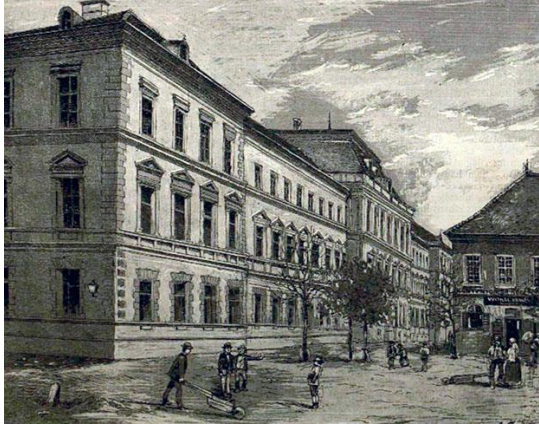
Nagyenyedi Református Kollégium

Ugyanide kapcsolódik Nagyenyed városának esete. Köztudott tény, hogy a református kollégium minden évben megszervezi a megemlékezést a II. Rákóczi Ferenc vezette kuruc szabadságharc nagyenyedi hős diákjai tiszteletére. Az egésznapos rendezvény záróeseménye a diákok