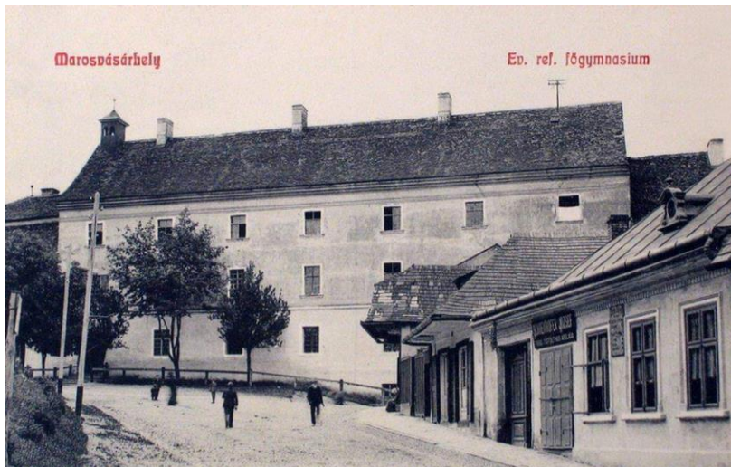
Marosvásárhelyi Református Kollégium

szóltak, hogy ebédre félig romlott ételt kapnak. A bentlakók úgy fogtak össze, hogy egy előre megbeszélt időpontban meggyújtott szalmát lógattak ki a bentlakás ablakain. Mivel a kollégium a város egyik legmagasabb pontján fekszik, az égő szalma azt a hatást keltette, hogy az iskola épülete is lángra kapott. Elképzelhető, mekkora kétségbeesést okozott a lakosság körében! Ezzel a fajta figyelemfelkeltéssel a diákok végre elérték, hogy a kollégium vezetője meghallgassa őket, és orvosolja a gondokat. Bolyai Farkas, a kollégium matematika-, fizika- és kémiaprofesszora, később a diákok mellett érvelve megjegyezte, hogy valóban elkeserítő a kollégisták ellátása.