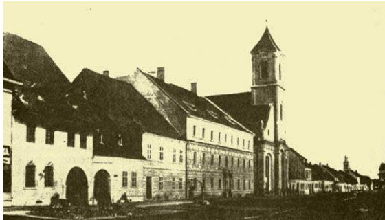
Kolozsvári Unitárius Kollégium

Az ember ennyi elrettentő példa után elvárná, hogy legalább Erdély központjának, a nagymúltú Kolozsvárnak tanodáiban minden az előírásoknak megfelelően működjék. Szomorúságra ad okot viszont az, hogy a diákok itt is kendőzetlenül felszínre hozták sérelmeiket. Ez nem csoda, hisz Magyarország híres tanintézményeinek vezetői, tanárai és néhány diák is állandó levelezést folytat társaival.