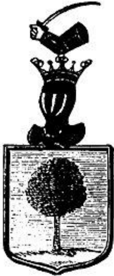
A Bors család címere

Jajszótól visszhangzanak Erdély bércei. Egyetlen nap alatt foszlottak szerte az erdélyiek reményteljes vágyálmai, miszerint a török igát és rabláncot végre levethetik magukról. Hatalmas létszámú tatársereg dúlta fel Csíkot és környékét, sosem tapasztalt mértékű pusztítást hagyva maga után.