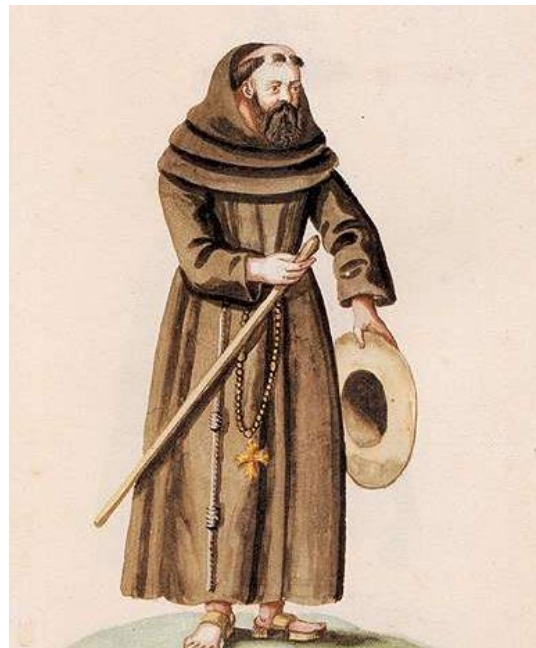
Ferencs szerzetes- vízfestmény

Arról is beszámolt kérdeztünk, hogy Csíksomlyó lakossága ezekben a nyomorúságos időkben sem felejtette el, hogy egyedül Istentől várhat szabadítást. A remetelak 12 szerzetese az utolsó pillanatig próbálta tartani a lelket a megrendült hívekben. Sokan faragott fakeresztjeiket csókolgatva rebegtek imát, mások