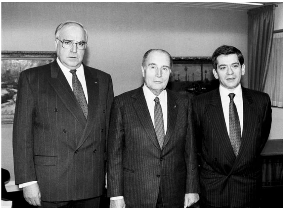
H. Kohl, F. Mitterrand és E. B. Crespo 4

Az Európai Parlament hónapokon át egyeztetőfórumként szolgált a Németország újraegyesítésének előkészítésével megbízott európai vezető politikusok számára. Novemberben a parlament elnöke, „Enrique Barón Crespo a szabadság európai győzelmét üdvözlendő szót kívánt ejteni a berlini fal leomlásáról és annak geopolitikai következményeiről, ezért felkérte mind Helmut Kohl német kancellárt, mind François Mitterrand francia elnököt, aki akkor az Európai Tanács hivatalban lévő elnöke is volt, hogy Strasbourghban mondjanak beszédet a parlamenti képviselők ülésén.